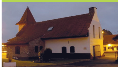
La Ferme du Cauquier

En organisant le 31 e forum du 17 au 19 mai 2017, en collaboration avec la ville de Lys-lez-Lannoy, AGORES revient avec plaisir dans cette belle région qu'est le Nord où le sens de l'hospitalité n'est pas un vain mot.