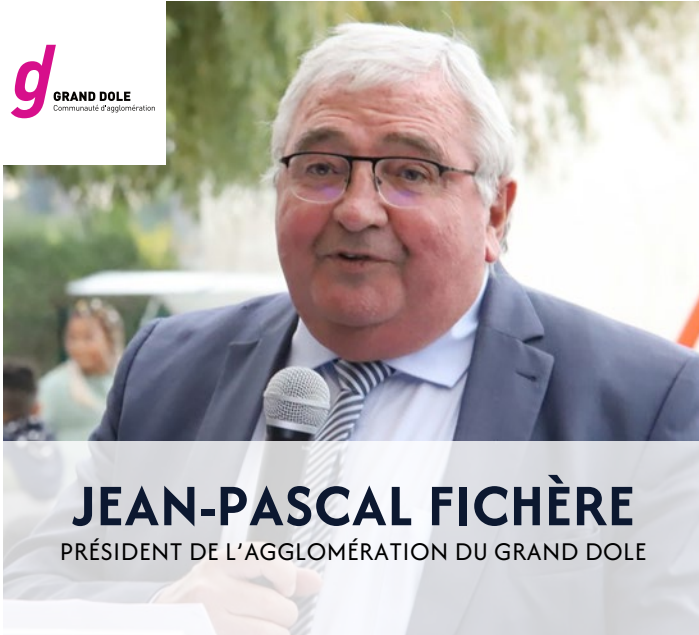
JEAN-PASCAL FICHÈRE PRÉSIDENT DE L'AGGLOMÉRATION DU GRAND DOLE