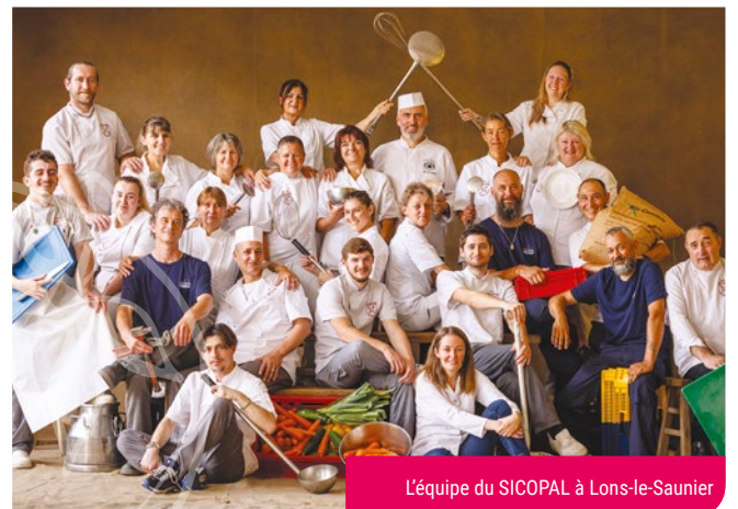
L'équipe du SICOPAL à Lons-le-Saunier