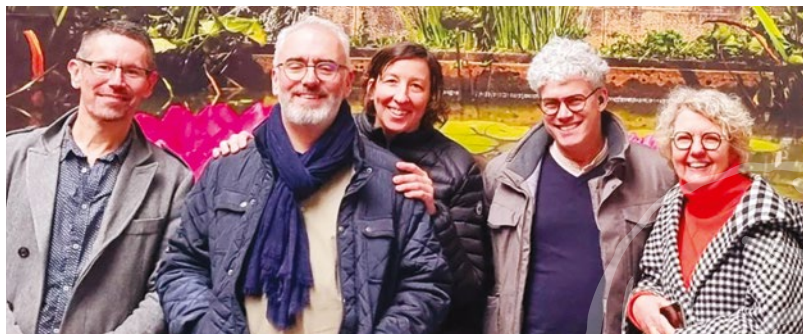
Comité de pilotage du 39 e Forum (de gauche à droite) :

Merci à vous tous pour votre travail, votre engagement et votre loyauté : la force de l'unité est porteuse d'espoir pour l'avenir !