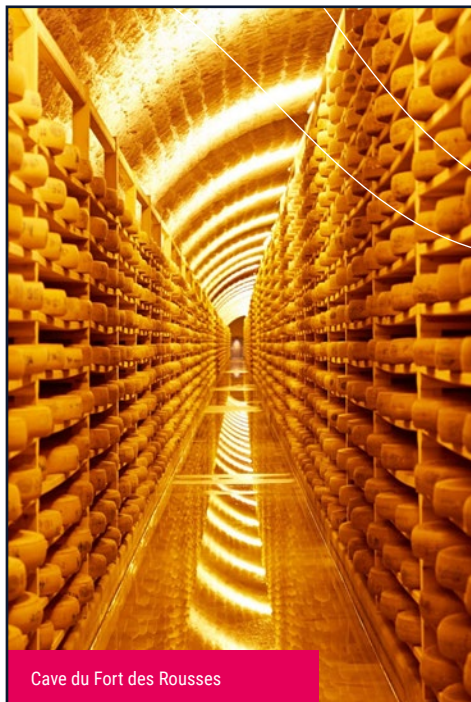
Cave du Fort des Rousses