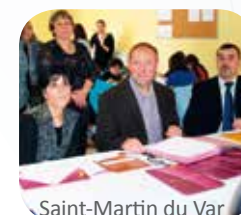
Saint-Martin du Var