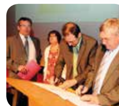
Région Pays de la Loire Ville de Nantes Conseil Général de Loire Atlantique